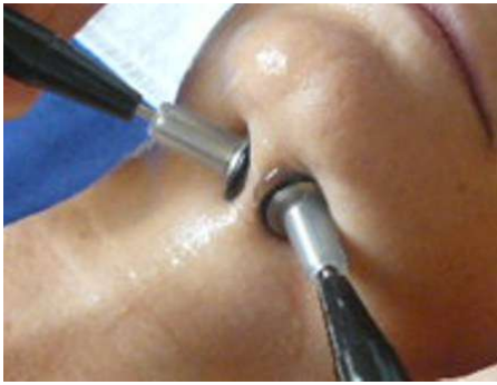
Foto 1. Técnica de aplicación en papada.

Radiofrecuencia monopolar: se utilizaron los dos electrodos circulares para trabajar la papada con muy buena tolerancia. Las arrugas profundas y surcos faciales se trabajaron con el electrodo selectivo, siendo necesario mover el electrodo fijo ya que los pacientes referían molestias (quemazón) en la región donde se dejaba inmóvil el electrodo.