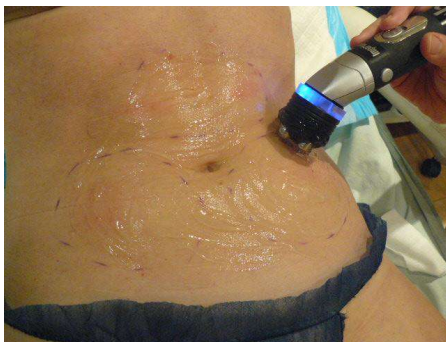
Foto 2. Técnica de aplicación en abdomen.